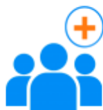
Stage / Formation