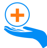
Appel aux dons